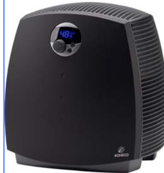
Lufttvättare Boneco 2055D* med avancerad digital teknik